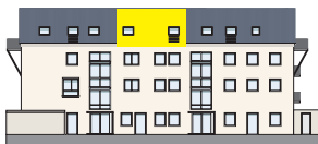
Nordansicht DG | Wohnung 10