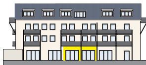
Südensicht EG | Wohnung 2