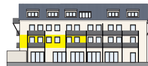
Südansicht 1. OG | Wohnung 5