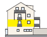
Westansicht 1. OG | Wohnung 5

Alle Visualisierungen und Grundrisse sind unverbindlich.