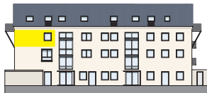
Nordansicht 2. OG | Wohnung 6