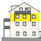
Ostansicht 2. OG | Wohnung 6