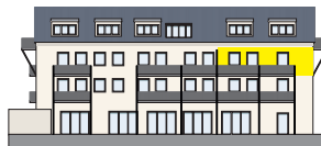
Südansicht 2. OG | Wohnung 6