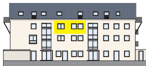
Nordansicht 2. OG | Wohnung 7