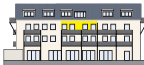
Südansicht 2. OG | Wohnung 7